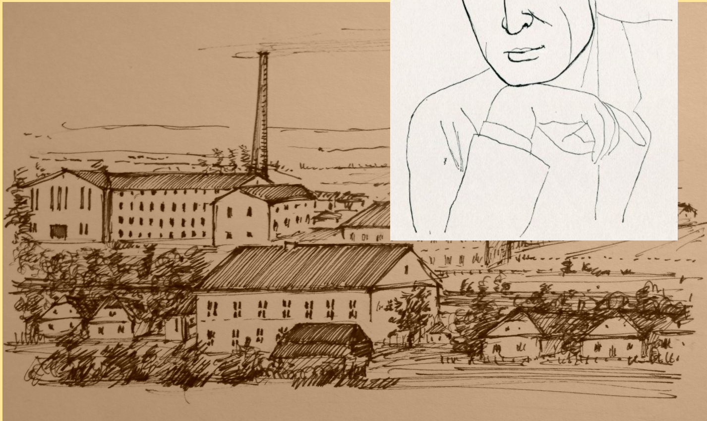
Bývalý hájecký cukrovar—místo narození Vladislava Vančury

Jak zjistil člen jiné větve rodiny Vančurů, Antonín, známý pod pseudonymem Jiří Mahen, byli jejich prapůvodními předky starobylí a ctění Vančurové z Řehnic na Mladoboleslavsku. Však se k nim v budoucnu hájecký rodák přihlásil svou Markétou Lazarovou. Stejně jako v předcích v něm kolovala protestní protestanská krev, jak svědčí už křest. Nic takového se ovšem netušilo, když poprvé zakňoural a zakřičel v cukrovaru.